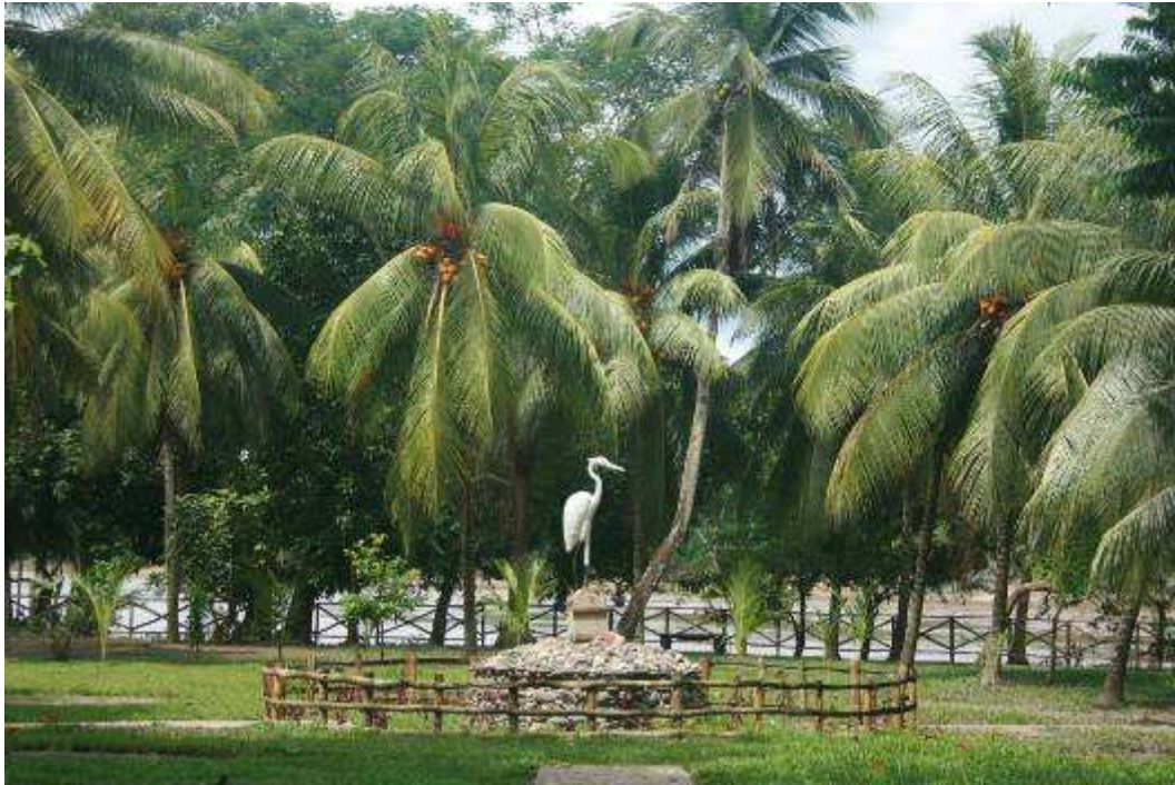
Parque de los Héroes de Chazuta.