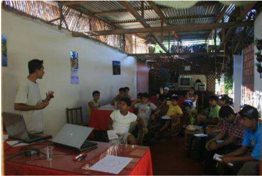
Taller de Gabinete – Sauce