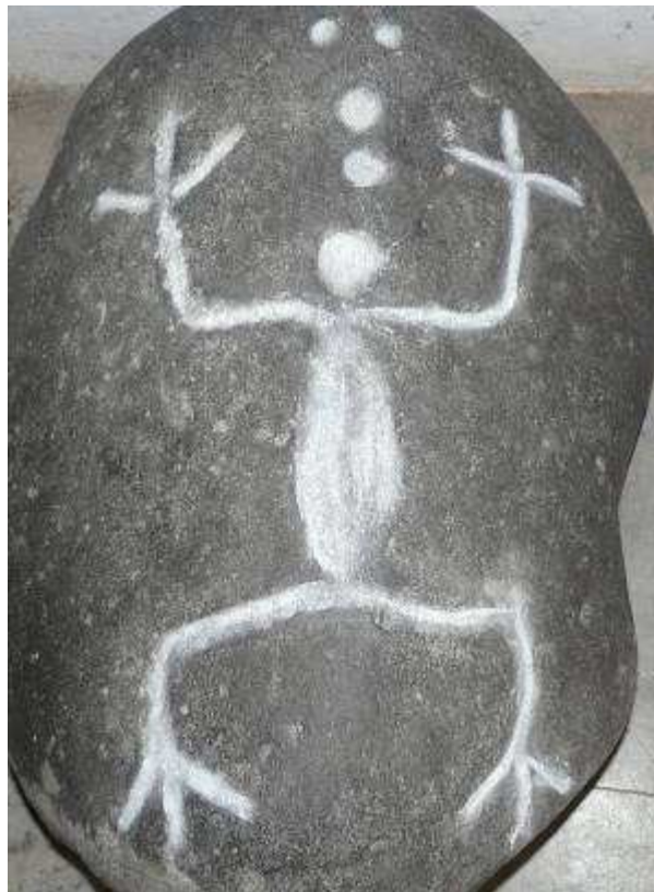
Petroglifo Representativo de Chazuta