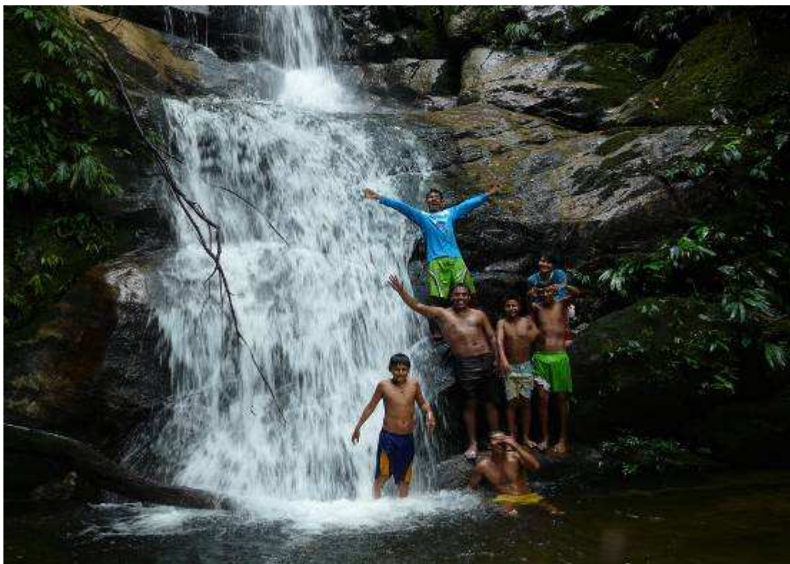
Cascada de Pucayacu