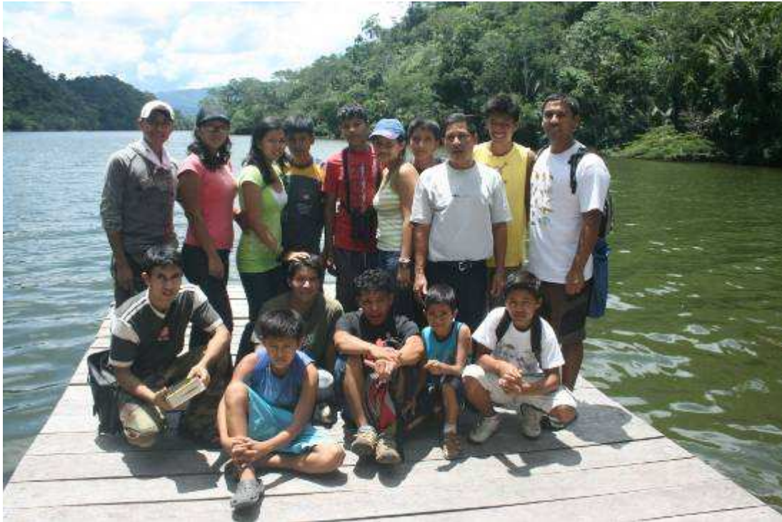
Grupo de Guías en la Laguna de Sauce